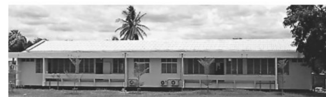
อาคาร 70 ปี พระอาจารย์บุญมี ธีมมรโต 30 ปี มูลนิธิดวงแก้ว ในพระสังฆราชูปถัมภ์ รพ.วังเจ้า จ.ตาก