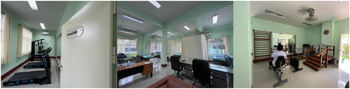
คลินิกแพทย์แผนไทยและแพทย์ทางเลือก