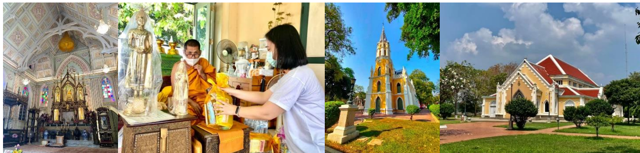
20 กพ. 65 วัดถ้ำประทุน-ภาวนาสัจจ

ปัจจุบันมีพระสงฆ์อยู่จำพรรษาหลายรูป และยังมีสามเณรเกือบร้อยที่เข้ามาเรียนหนังสือที่วัดแห่งนี้ มีการดูแลรักษาสถานที่อย่างดี แต่ปัญหาเรื่องความสกปรกจากนักท่องเที่ยวที่ไม่มีควมสำนึกในการที่จะร่วมกันรักษาดูแลศาสนสมบัติอันสำคัญยิ่งนี้ ยังมีอยู่เป็นจำนวนมาก!