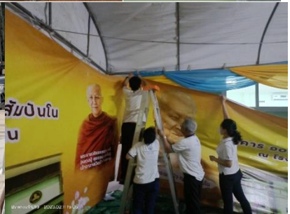
12 ก.พ. 66 วันมอบอาคาร 108 ปี หลวงตาพระมหาบัวฯ (ช่วงเช้า)