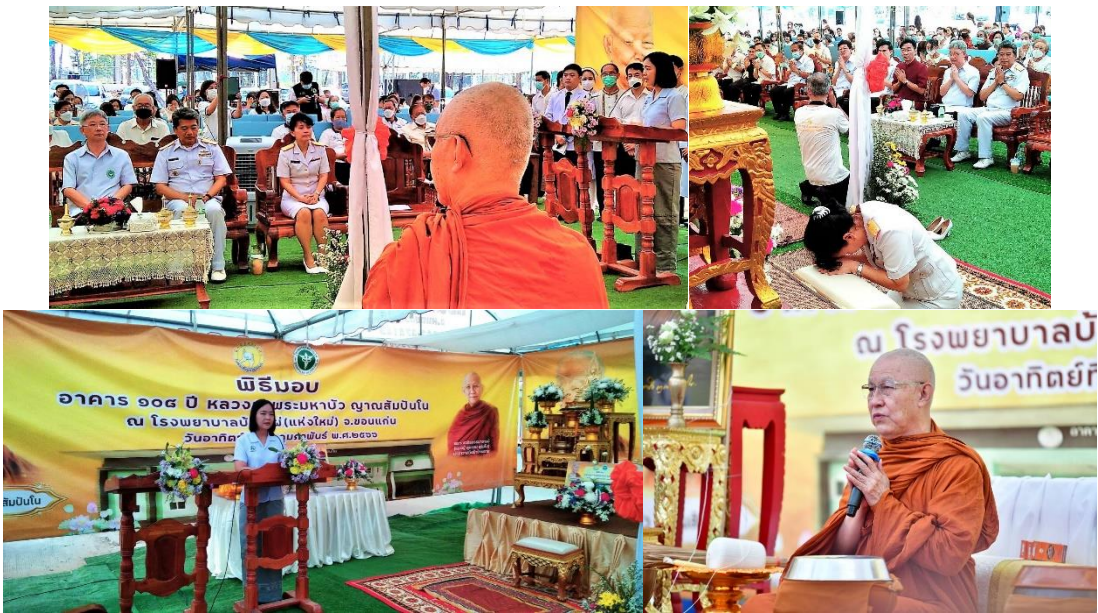
14 ก.พ.66 ค่ำวันพระภาวนา