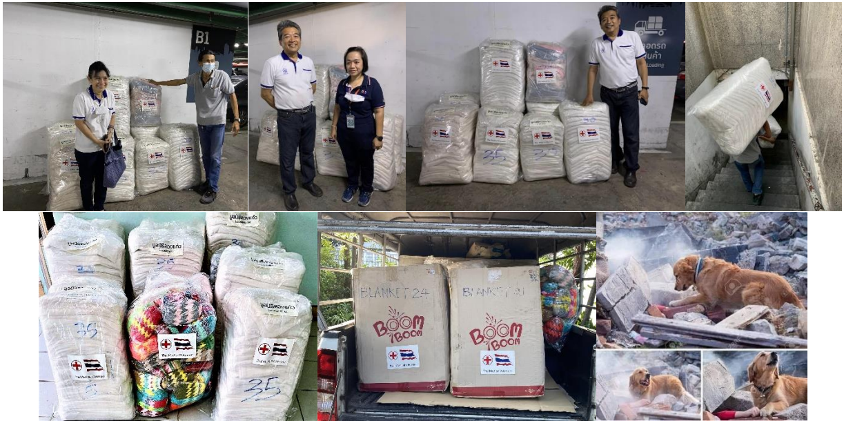
16 ก.พ.66 วัดใหญ่ชัยมงคล

เยี่ยมคุณแม่สมจิตร์วัดใหญ่ รายงานเรื่องมอบอาคารที่รพ.บ้านไผ่ และคุยกันเรื่องการสร้างอาคารรพ.ที่ดงหลวงต่อไปในปีนี้นะครับ เดือนหน้าอาจได้มาปฏิบัติภานาที่อุษยาก็ครั้งครับ