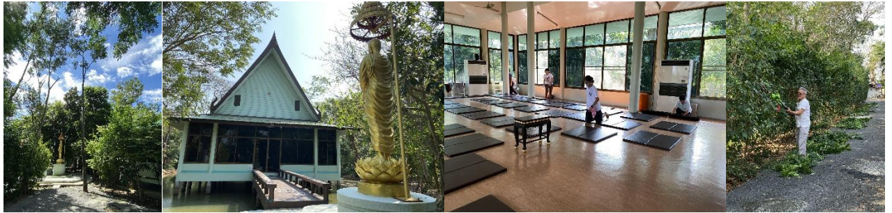
20 ก.พ. 66 ค่ำวันพระเนสันชิกภาวนา

17-19 ก.พ.66 ร่วมใจเตรียมการอบรมปฏิบัติภาวนา ขอบพระคุณน้ำใจของทุกๆ ท่านที่ช่วยกันรักษาสถานปฏิบัติภาวนาขององค์หลวงตาบ้านตาดแห่งนี้ไว้ร่วมกันนะครับ กราบอนุโมทนาครับ การตั้งใจช่วยรักษาส่งเสริมการปฏิบัติภาวนานั้นสำคัญมาก จิตที่ตั้งไว้ดีแล้ว ย่อมส่งผลเป็นบุญเป็นกุศล ขณะปวดควาตเช็ดดู ล้วนกระทำด้วยสติ มีปัญหาประกอบ การทำงานนั้นๆย่อมปราณีต ละเอียดสมบูรณ์ สวยงาม การทำงานนั้นจึงเปรียบเสมือนการปฏิบัติธรรมไปด้วย การภาวนาไม่จำเป็นต้องนั่งหลับตา หรือเดินไปมา การทำงานที่ประกอบด้วยสติปัญญา มีเจตนาในธรรม ย่อมเป็นการภาวนา มรผลเป็นบุญกุศล บารมียิ่งใหญ่ กราบสาธุอนุโมทนาในบุญนั้นๆของทุกๆท่านครับ