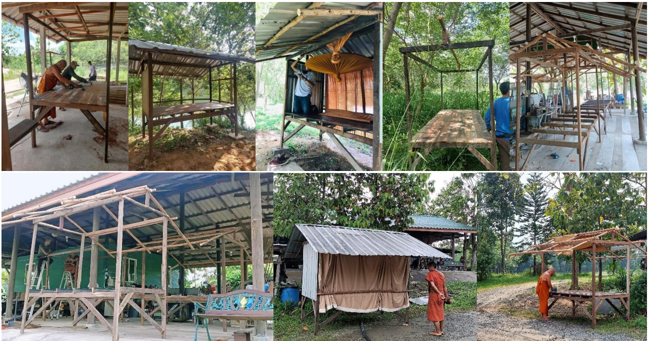
23 มี.ค. 65 ปรับแต่งพื้นที่สำหรับก่อสร้าง อาคาร108 ปี หลวงตาพระมหาบัว

ที่พัทภวานาที่เราไปกันอาจไม่ได้สะดวกสบายหรูหรานัก แต่เหมาะแก่การภวานา ครูจารย์หลวงตาพระมหาบัวท่านเล่าให้ฟังเสมอๆตอนที่เรายู่ที่วัดว่าการภวานาตามปฏิบัติพาแม่ครูอาจารย์นั้นไม่เคยสบาย ครูจารย์ใหญ่-ท่านอาจารย์มั่นไม่เคยใส่ใจเรื่องกรกินอยู่ กุฎิ ศาลา เสนาสนะว่าจะเป็นเช่นไร ปานะ-จะมีน้ำตาลน้ำหวาน ไม่ต้องคิดถึง แต่ปัจจุบัน-แตกต่างกันอย่างมากนัก พวกเราขอเดินตามทางที่พ่อแม่ครูอาจารย์พาดำเนินกันต่อไปครับ อดบ้างลำบากบ้าง ก็ฝึกเอา จะลำบากบ้างก็คงคุ้นชินสำหรับเด็กวัดอย่างเราแล้ว ไม่ได้รำวย บัจจยที่พอมีกัทำตามทางที่ครูจารย์นำพา ช่วยเหลือสนับสนุนการปฏิบัติภวานา งานสาธารณสงเคราะห์ไปตามที่พอ กระทำได้เท่านั้น กราบระลึกพระคุณพ่อแม่ครูอาจารย์ที่เคารพทุกท่าน