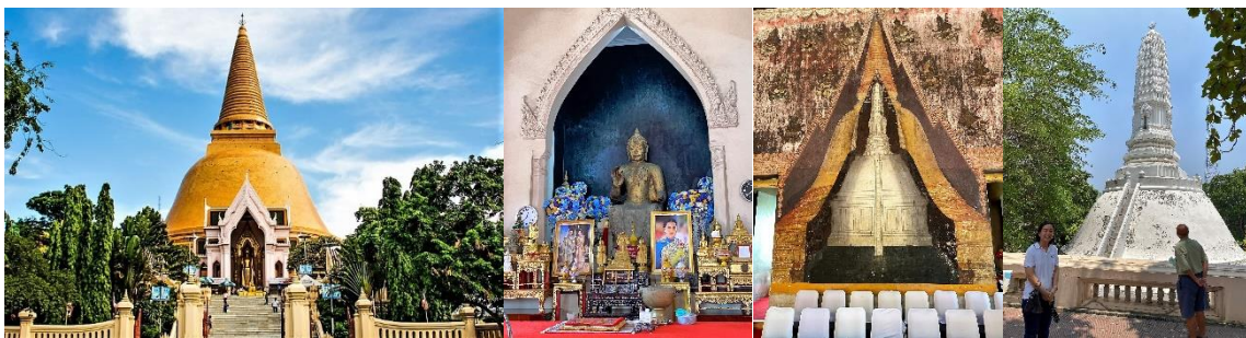
วัดสัมปทวน นครชัยศรี

ในสมัยรัชกาลที่ 7 ทรงโปรดให้สร้างพระอุโบสถใหม่ องค์พระปฐมเจดีย์เพื่อเป็นที่ประดิษฐานพระบรมสารีริกธาตุของสมเด็จพระสัมมาสัมพุทธเจ้า ให้เป็นที่เคารพสักการะของบรรดาศาสนิกชนทั่วโลก