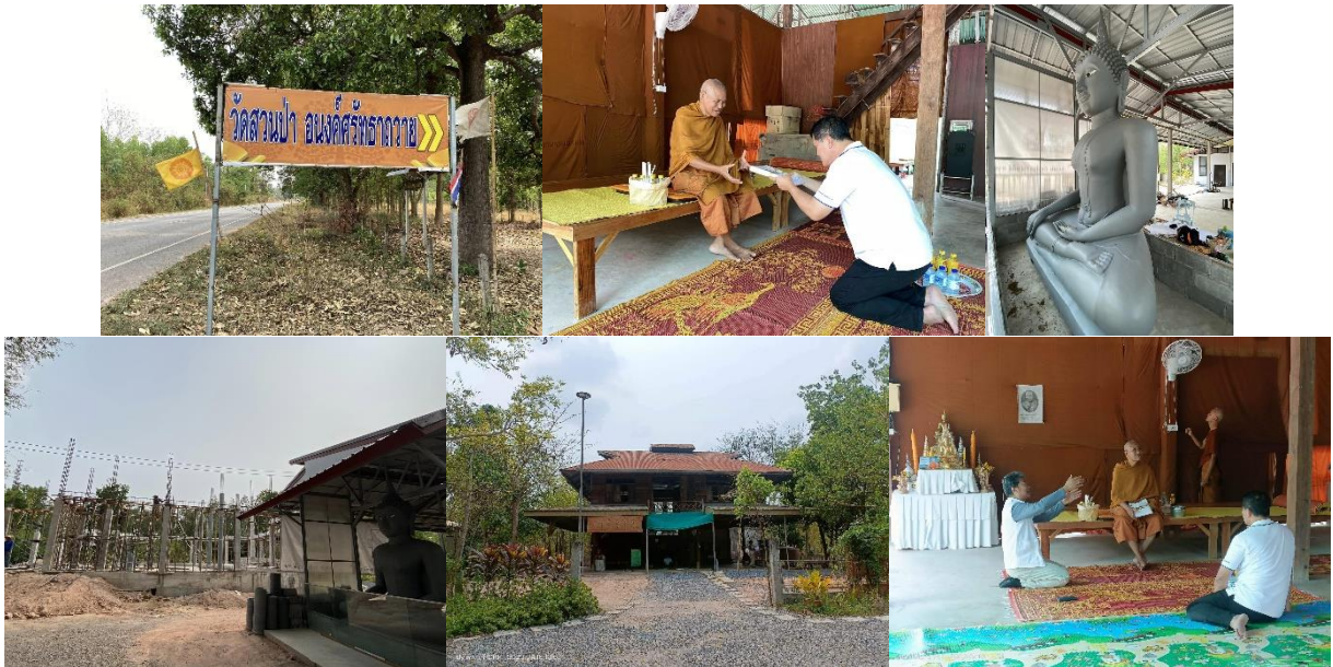
วัดป่าศรัทธาถาว เข็มครุบาสันติสุข

กราบถวายผ้าบังสุกุล ปัจจัยไทยธรรม พ่อแม่ครูอาจารย์บุญมี ณ วัดสวนป่าอนงค์ฯ หนองบัวลำภู กราบเรียนเรื่องขออาราธนาครูอาจารย์เป็นประธานการเททองหล่อองค์พระเจดีย์"กตเวทิตา" ณ วัดป่ากตัญญูตาราม ปลายเดือนมิถุนายน และร่างการเดินทางจาริกบุญศึกษาเซน ณ ประเทศญี่ปุ่นกลางเดือนหน้าครับ