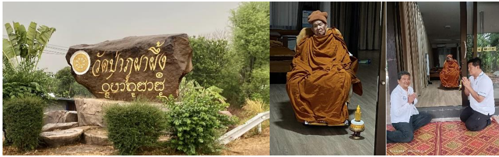
วัดเกาะทอง กราบท่านอาจารย์มหาบุญตา