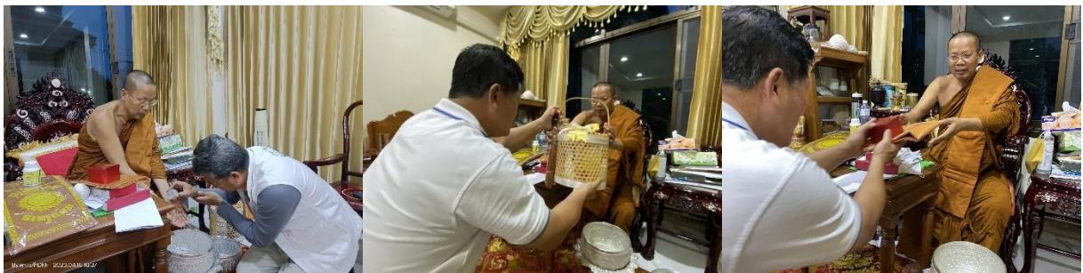
19 เมษายน 66 พิธีวางศิลาฤกษ์" อาคารดวงแก้วรวมใจ"

กราบรอน้ำขอพรจากท่านบ่าวทองเจ้าคณะอำเภอบ้านไผ่ ที่เมตตาพาพวกเรามาโดยตลอด และปรึกษาเรื่องการจัดกิจกรรม ตักบาตร-ฟังธรรม ณ รพ.บ้านไผ่ด้วยครับ