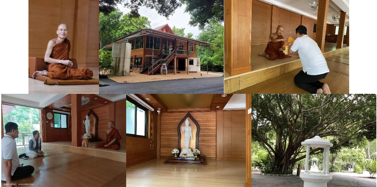
สวนป่า อนงค์ศรัทธาถาว

กราบถวายผ้าบังสุกุล ปัจจัยไทยธรรม พ่อแม่ครูอาจารย์บุญมี ณ วัดสวนป่าอนงค์ฯ หนองบัวลำภู กราบเรียนเรื่องขออาราธนาครูอาจารย์เป็นประธานการเททองหล่อองค์พระเจดีย์"กตเวทิตา" ณ วัดป่ากตัญญูตาราม ปลายเดือนมิถุนายน และร่างการเดินทางจาริกบุญศึกษาเซน ณ ประเทศญี่ปุ่นกลางเดือนหน้าครับ