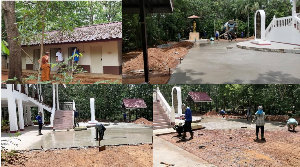
30 มิ.ย. 66 อาคาร 87 ปี หลวงปู่อ้วนฯ สองเดือนผ่านไป งานเริ่มงวดที่สี่แล้วครับ ต่อไปก็วางแผ่นพื้น เทพื้นชั้นล่าง-ห้องตรวจพิเศษ และชั้นสอง-ทันตกรรมแล้วครับ