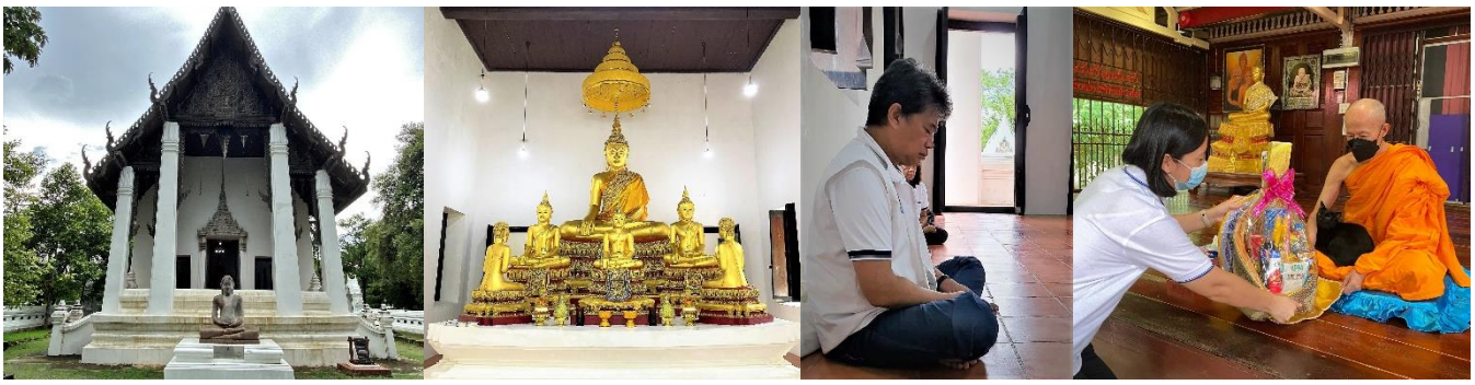
วัดวรเชต -ภาวนาสัญจร -

นอกจากวัดธรรมารามก็มานั่งภาวนากันต่อที่วัดวรเชต ห้าโมงเย็นเสร็จก็ออกไปกราบถวายปัจจัยไทยธรรมแด่ท่านเจ้าอาวาส ณ อุโบสถใหม่ริมสระบัว สวยงามมากๆครับ มีภาพเขียนพระราชากรณียกิจของรัชกาลที่ 9 อยู่ที่ผนังด้วย