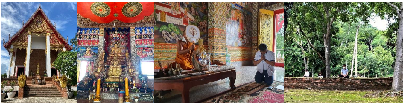
วัดภูเขาทอง-ภาวนาสัญจร-

นอกจากวัดธรรมารามก็มานั่งภาวนากันต่อที่วัดวรเชต ห้าโมงเย็นเสร็จก็ออกไปกราบถวายปัจจัยไทยธรรมแด่ท่านเจ้าอาวาส ณ อุโบสถใหม่ริมสระบัว สวยงามมากๆครับ มีภาพเขียนพระราชากรณียกิจของรัชกาลที่ 9 อยู่ที่ผนังด้วย