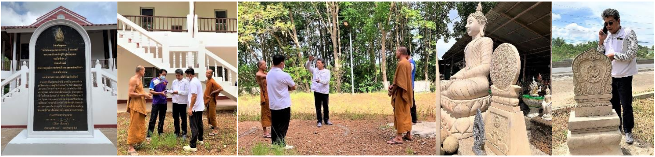
8 กค.65 วัดนิมทายิกาวาส