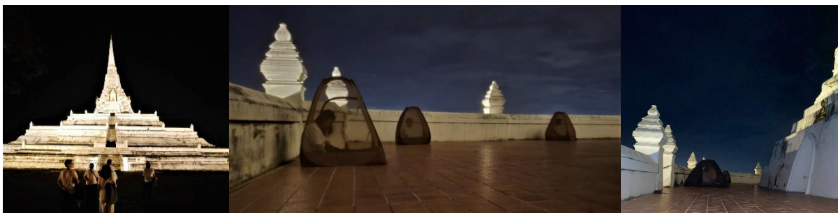
24 กค. 65 วัดมเหยงคณ์ - ปล่อยปลา-ตักบาตร-

ตั้งแต่หนึ่งทุ่มก็มีลมเย็นๆ พัดผ่านมาตลอด พอเที่ยงคืนอากาศก็เริ่มหนาวจนต้องเอาผ้ามาห่มเลยครับ สงสัยหลวงปู่เปิดแอร์ให้ แล้วอากาศก็ดีสุดๆ ฝนไม่ตก อากาศสดชื่นมากๆครับ เป็นโอกาสดีจริงๆครับ กราบอนุโมทนาบุญกับทุกๆท่านครับ ร่วมกันรักษาพระธรรมวินัย-พระพุทธศาสนา ด้วยการปฏิบัติบูชากันครับ