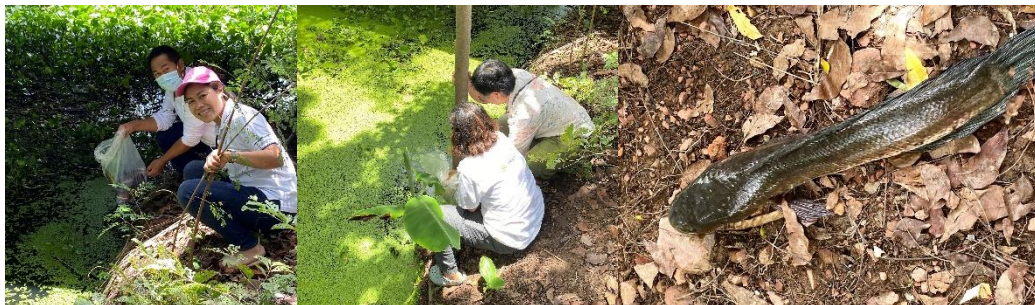
ปล่อยปลูปล่อยพันธนาการ

ปล่อยปลาปล่อยชีวิต คณะมูลนิธิดวงแก้วฯร่วมกับปล่อยปลาปล่อยชีวิตเป็นทาน ให้สรรพชีวิตเป็นสุขพ้นจากการทุกข์ทรมาน ณ วัดป่ามหาชัย ทั้งปลาไหล 10 ปลาช่อน 10 กก.และปลาตุ๊ก 2 กก. มาอยู่ที่วัดแห่งนี้คงสบายใจปลอดภัยมีสุข พ้นจากการถูกประหารแล้วนะ หวังว่าชีวิตเขาคงมีความสุขตลอดไป อนุโมทนาบุญกับทุกๆท่านครับ