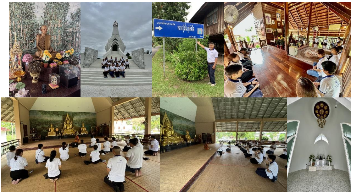
วัดภูห่ม (9) กราบท่านอาจารย์สมัยวัดภูห่ม เสร็จแล้วนั่งสมาธิภาวนา หน้าถ้ำองค์หลวงปู่มั่น เป็นการปฏิบัติ บูชา ลงมาจากภู ท่านอาจารย์เตรียมอาหารกลางวันแสนอร่อยไว้ให้ด้วย เลยเสียเวลาไปนานเลยครับ มาครั้งนี้เจอคุณ หมอวิเชียรมาปฏิบัติภาวนาที่นี่ด้วย กราบอนุโมทนาบุญครับ มาที่นี่ครั้งใด ก็ระลึกถึงพระอาจารย์ศรีทน ที่ร่วมกันพัฒนาภู ห่มมาด้วยกันตั้งแต่ปี 2536-37 แล้วก็ได้พบครูบาอาจารย์ท่านอื่นๆที่วัดอีกด้วยเช่น ท่านสมัย ท่านไต้ง ท่านโอมฯ