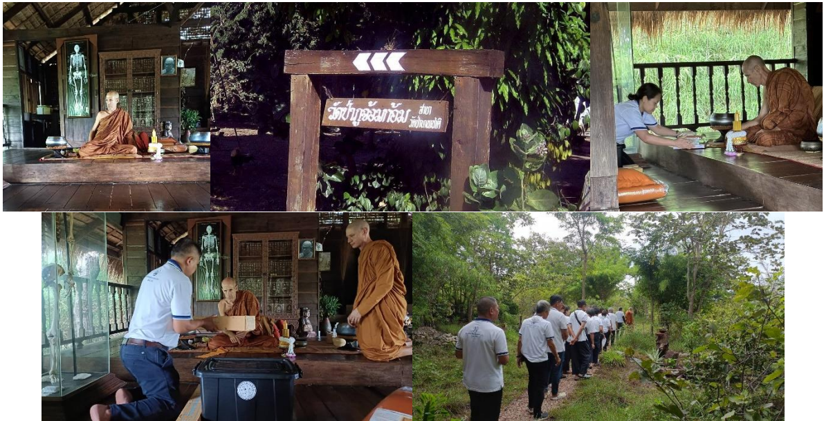
วัดศรีบุญเรือง - บ้านองค์หลวงปู่มั่น (8) กราบองค์หลวงปู่มั่นที่บ้านเกิดท่าน ณ วัดศรีบุญเรือง เสร็จแล้วนั่งสมาธิภาวนา บูชาคุณองค์หลวงปู่ที่อนุสรณ์สถานที่ที่บ้านเกิดท่าน ก่อนจะลากลับกันครับ