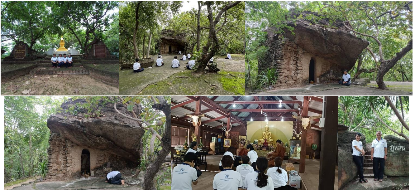
วัดภูจันแดง (10) กราบท่านอาจารย์โอม วัดภูจันแดง หนึ่งในศิษย์ของท่านอาจารย์ศรีทนต์ -ภูหล่น