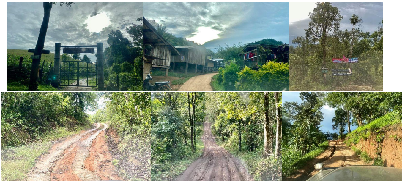
25 กย. รพ.บ้านตาก

การเดินทางไปวัดถ้ำผาดำ คุณหมอจระพงค์ ท่านขึ้นล่องบนดอยแม่ตื่นมาตลอดตั้งแต่เริ่มมารับราชการที่รพ.แม่ระมาดนี้ เกือบสามสิบปีได้ คุณเล่าเรื่องการรักษาพยาบาล ยาเสพติดฯ ท่านว่าสมัยก่อนต้องเดินเท้ากันเป็นวันๆ ปัจจุบันดีหน่อยเอารถ ขึ้นได้แล้ว ท่านว่าสมัยก่อนเป็นป่าที่อุดมสมบูรณ์ แต่เดี๋ยวนี้เป็นป่า..ข้าวโพดแทน 😞 ไม่มีคุณหมอนำทางเราก็คงไปไหนไม่ไหวครับ เราต้องจอดรอไว้ที่สถานีอนามัยแล้วใช้รถท่านขึ้นเขาต่อ ทางก็อย่างที่เห็นในภาพนะครับ ไปถึงวัดก็เย็นแล้วสี่ห้า ชม.ได้ ปรึกษากันเรื่องให้ความช่วยเหลือผู้คนชาวบ้านบริเวณนี้ ท่านว่าอย่างที่เรามาขอมาแจก มาออกหน่วยด้วยก็ดีแล้ว แต่ถ้าช่วยสถานีอนามัยเรื่องไฟฟ้าได้ก็จะยิ่งดี เพราะอนามัยที่นี่ก็คือรพ.ที่ต้องดูแลผู้ป่วยให้ได้จริงๆ สำคัญมากและหลายแห่ง ยังไม่มีไฟฟ้า พอคุยกันเรื่องนี้ ท่านอาจารย์มหาสมควรก็บอกว่าชาวบ้านหลายๆหมู่บ้านก็ไม่มีไฟฟ้าใช้ด้วย ถ้าเราช่วยได้ก็จะดีมาก เพราะทางการมาทำไฟฟ้าพลังน้ำไว้ให้สองสามเดือนก็เสียซ่อมไม่ได้ ถ้าทางมูลนิธิช่วยได้ท่านก็อยากให้เราช่วยจัดการให้ เราจึงรับปากว่าจะมาศึกษาหาข้อมูลและหาความช่วยเหลือไปให้ทั้งสองส่วนนี้ ส่วนท่านอ.มหาสมควร ตอนนี้ท่านพาชาวบ้านลาดปูนซีเมนต์ถนนบนดอยอยู่ครับ เพราะขึ้นลงลำบากและอันตรายมากๆ กราบอนุโมทนาบุญกับทุกๆท่านครับ