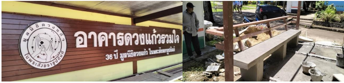
29 กย. 66 อาคาร87ปี หลวงปู่อ๊้อมฯ รพ.ดงหลวง

การก่อสร้าง อาคาร 87ปี หลวงปู่อ๊้อมฯ ณ รพ.ดงหลวง ขณะนี้ปูแผ่นพื้นชั้นสามเสร็จแล้วครับ กำลังเตรียมเทพื้น เทคานและตั้งเสาชั้นสามครับ เข้าไปหน่อยนะครับ ฝนตกหนักครับ แต่ครูจารย์แมวก้เมตตามาคูแลการก่อสร้างให้ เสมอๆ ครับ