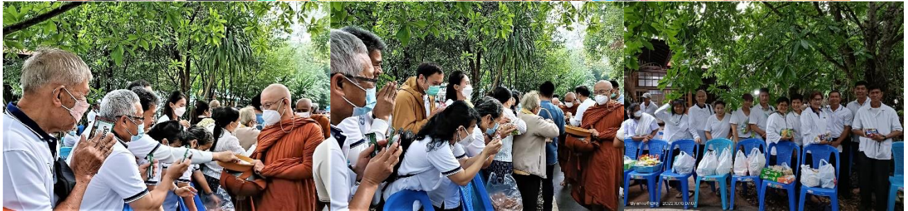
21 ตุลาคม 65 ส่งผ้าจํานำพรราชาไปถวายครูจารย์