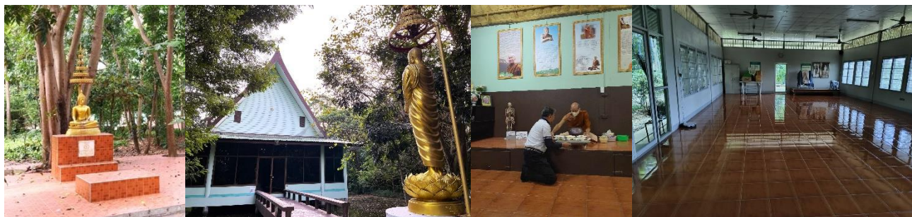
รูปเหมือนองค์หลวงตา

26 พ.ย. 66 ออกจากธรรมวิภาวันแต่เช้า ไปถวายจันทน์ท่านฐา ดูหลังคาที่พังลงมา ตาข่ายกันนกที่หอธรรมก็หลุดลงมาเกือบหมด ท่อน้ำใต้ดินที่รั่วก็แตก น้ำซึมเต็มถนน เลขคุยเรื่องแก้ไขวางท่อใหม่กัน เรื่องช่างที่จะซ่อมหอธรรม ซ่อมหลังคา และกำแพงโดยรอบก็ยังไม่มียุติครบ รอไปรอมายะหมดไปอีกหนึ่งปีแล้ว เสรีเลย