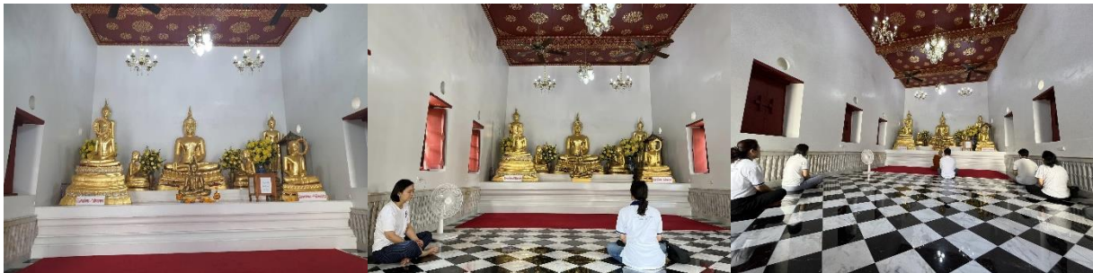
พระตำหนักแดงที่ประทับพระเจ้าตากสินมหาราช

อุโบสถเก่าวัตระฆังฯ นั่งภาวนากัน รอชาวคณะก่อนจะรวมตัวกันออกเดินทางไปภาวนาสัจจอร์ในยามเย็น