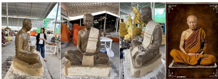
กราบเยี่ยมท่านเจ้าอาวาสวัดภูพร้าว 🍀

นอกจากวัชรธรรมก็มาโรงหล่อวิฑูฯ ช่างกำลังปั้นรูปเหมือนขององค์หลวงตาพระมหาบัวอยู่ แต่มีที่ดองแก้ไขบางส่วน จึงมาพูดคุยกันตามที่ครูบาอาจารย์ท่านแนะนำ ส่วนเรื่อง เจดีย์ " กตเวทิตา" พอดีช่างใหญ่วิฑูฯไม่อยู่จึงไม่ได้คุยกันเรื่องการทำให้ขององค์เจดีย์ทั้งภายในภายนอก และรายละเอียดต่างๆ แต่ก็เคยคุยตกลงไว้แล้ว คงไม่ผิดพลาดไปได้ นะครับ