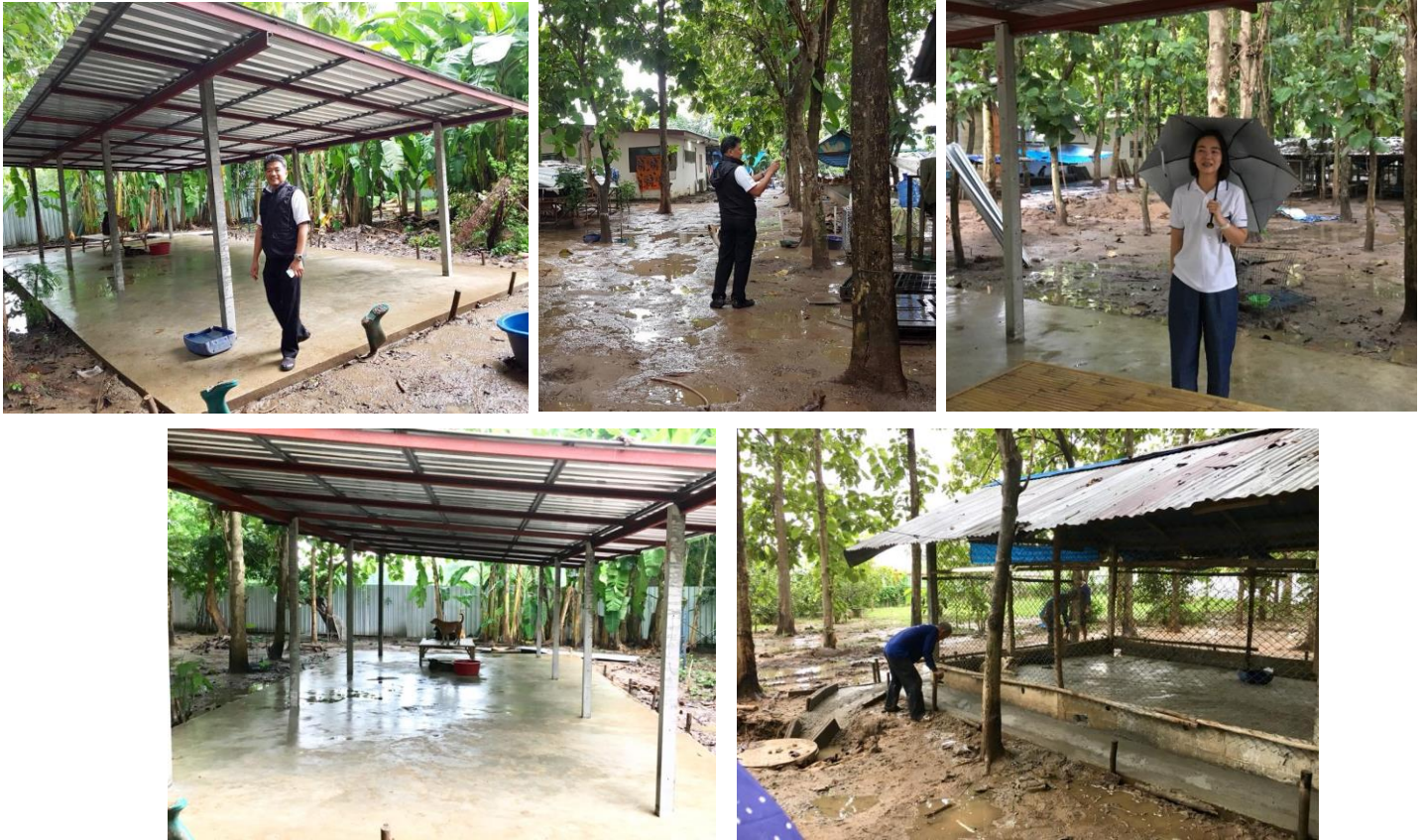
26 ส.ค. ถวายจังหัน-ทอดผ้าป่าวัดป่าไทรงาม

น้องๆหมาก็อยากู้้อยากเห็น ชอบไปรบกวนการทำงานของช่างอยู่เสมอๆ ทำงานแต่ละจุดก็ต้องกันน้องหมาออกไปที่อื่นก่อนด้วย หนึ่งเดือนผ่านไป ...ยังไม่ได้ตั้งใจฝัน. แต่มาดูงานที่ทำไปก็ชื่นใจแทนน้องหมานะครับ