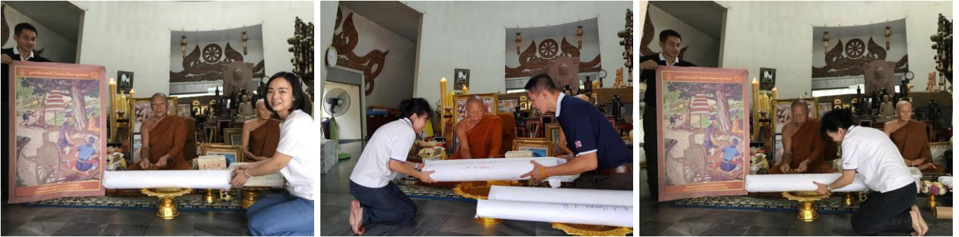
9-10 ส.ค. วัดแหลมทราย สงขลา