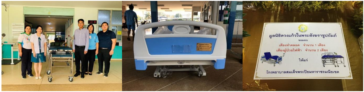
14 มี.ค. เตรียมเครื่องบูชาพระบรมสารีริกธาตุ ตระเวนรอบเมือง เริ่มจากร้านพรานสำหรับดอกไม้ที่สวยงาม เตรียมเครื่องประดับเพชรพลอยสวยๆประดับเครื่องบูชา เตรียมพระพุทธรูปหินหยกไว้ให้ผู้คนกราบไหว้ กระจ่างรูป แจกกัน เชิงเทียนล้วนคัดสรรให้สวยสมพระประธานในวัดแห่งนี้ตลอดไป