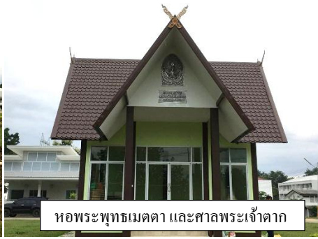
หอพระพุทธมตตา และศาลพระเจ้าตาก

29 ก.ย. ตรวจสอบการก่อสร้างอาคารนิตินิเวศ ที่รพ.สุโขทัย ตอนนี้เทพื้นตั้งเสาเสร็จแล้ว ครบกำลังก่อผนังบางส่วนและทำโครงสร้างหลังคาครบ อีกประมาณหนึ่งเดือนครึ่งก็คงจะเสร็จได้ นะครับ อาคารนี้ยังไม่ค่อยมีใครร่วมบุญมาเลยครับยังขาดปัจจัยอีกจำนวนมากทีเดียวครับ เพราะที่บริจาคมาตอนนี้คือหนึ่งหมื่นบาทครับ จึงขอกราบเรียนเชิญเพื่อนๆที่มีศรัทธาร่วมบุญกุศลนี้ได้นะครับ