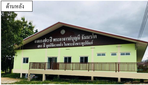
ด้านหลัง