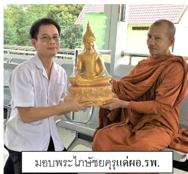
มอบพระโกษชัยครูแด่ผอ.รพ.

พระโกษชัยครู เป็น พระพุทธเจ้าบรมครู แห่งการแพทย์ มีความเมตตาประทาน ธรรมโอสถแก่สรรพสัตว์ทั้งปวง คือ พระพุทธเจ้าที่ได้อธิษฐานไว้ว่า หากได้ บรรลुธรรมเป็นพระพุทธเจ้าเมื่อใด ขอให้พุทธเกษตรของท่านปราศจาก