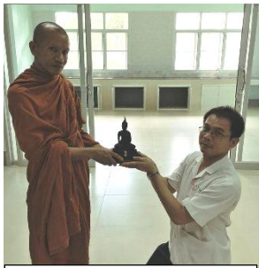
มอบพระพุทธรูปดินทร์ประจำตึก