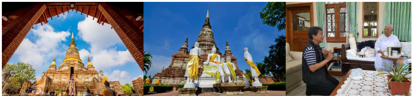
วัดมงคลบพิตร วัดพระศรีสรรเพชญ์