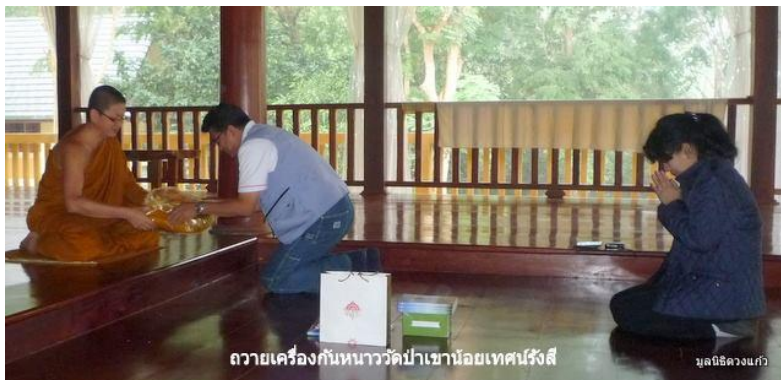
ถวายเครื่องกันหนาววัดป่าเขาน้อยเทศน์รังสี

10 ธ.ค. กราบถวายจังหันวัดป่าเขาน้อยเทศน์รังสี กับเจ้าอาวาสวัดป่ามณีพฤกษ์ ถวายเครื่องกันหนาวผ้าห่มทั้งสองวัดพร้อมปัจจัย 4200 บาท