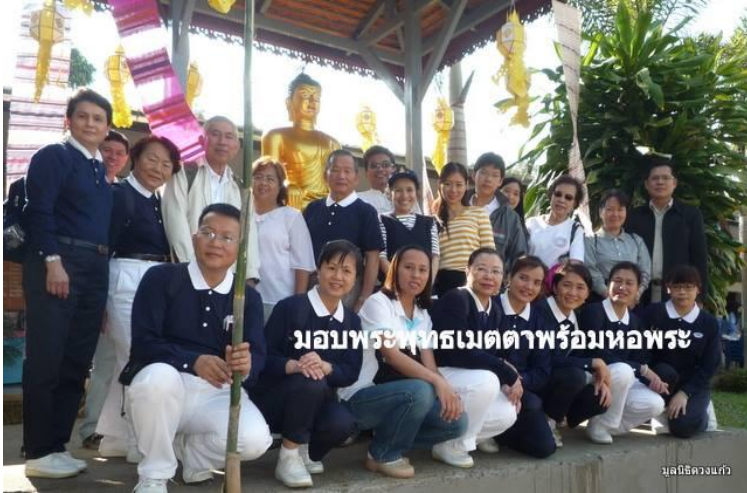
มอบพระพุทธรูปเมตตาพร้อมห่อพระ