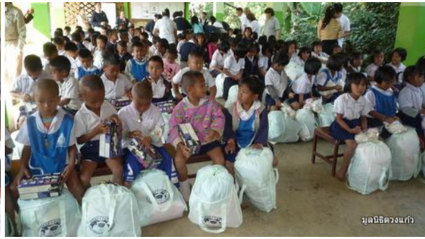
มูลนิธิดวงแก้ว