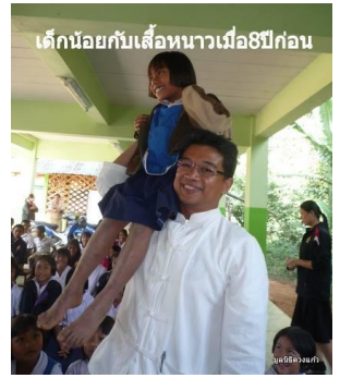
เด็กน้อยกับเสื่อหนาเมื่อ8ปีก่อน