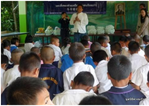
มูลนิธิดวงแก้ว