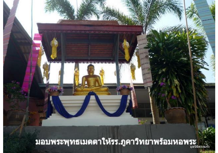
มอบพระพุทธรูปเมตตาให้รร.กุฉวิทยาพร้อมห่อพระ