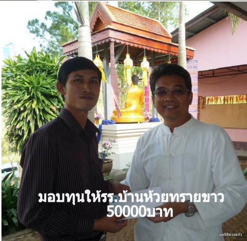
มอบทุนให้รร.บ้านห้วยทรายขาว 50000บาท