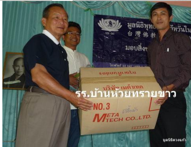
ร.บ้านห้วยทรายขาว