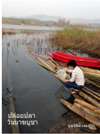
ปล่อยปลา วันมาฆบูชา