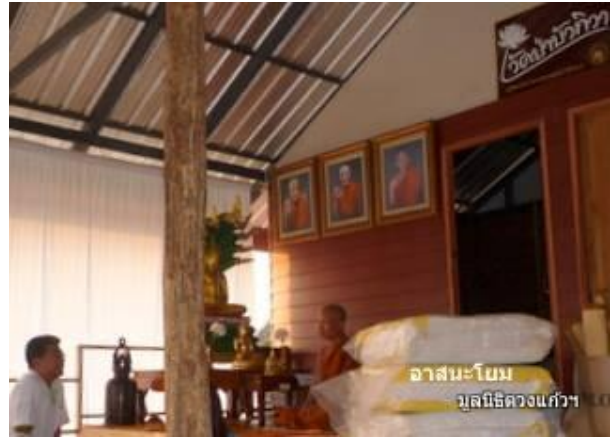
อาสนะโอบม