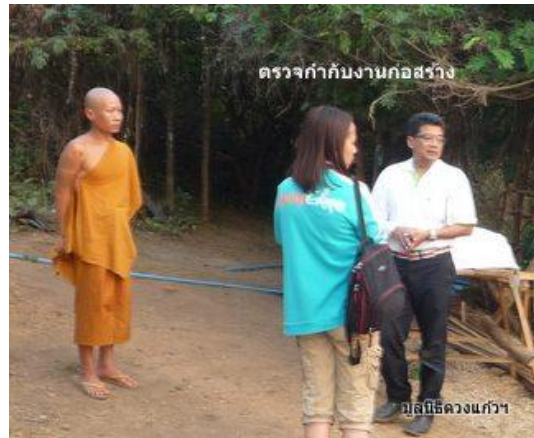
ตรวจกำกับงานก่อสร้าง