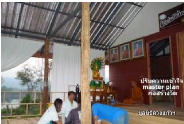
ปรับความเข้าใจ master plan ก่อสร้างวัด