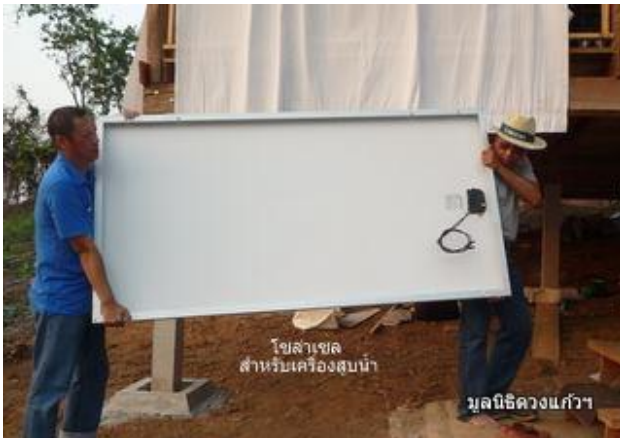
โซลาเซลล์ สำหรับเครื่องสูบน้ำ