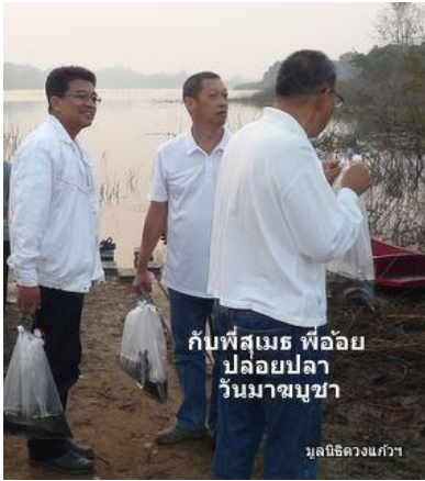
กับพี่สุเมธ พี่อ้อย ปล่อยปลา วันมาฆบูชา