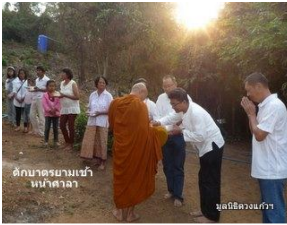
ด็กบวชยามเช้า หน้าศาลา