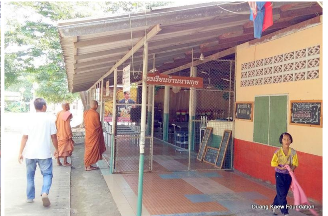
Duang Kaew Foundation