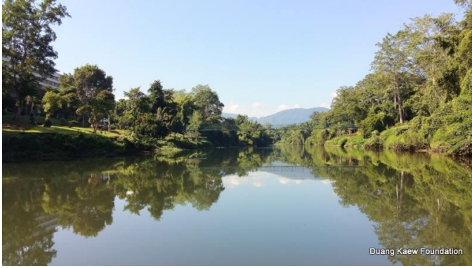
Duang Kaew Foundation