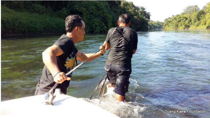
Duang Kaew Foundation