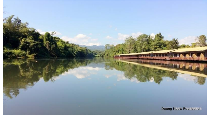
Duang Kaew Foundation