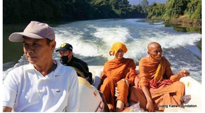
Duang Kaew Foundation