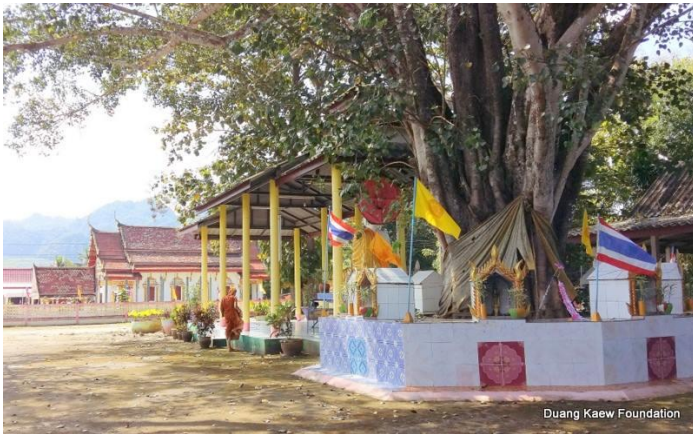
Duang Kaew Foundation