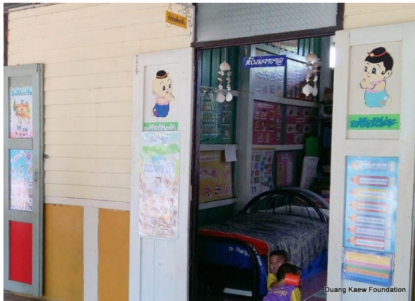
Duang Kaew Foundation