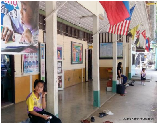
Duang Kaew Foundation